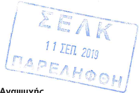
Γιάννης Τσαγκάρης Έφορος Φορολογίας